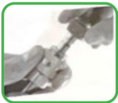
5. Installatie van een multifunctionele sprinkler