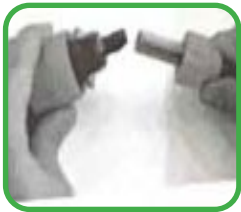
1. Sluit de waterleiding aan op de adapter