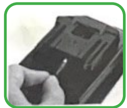
8. Hoe naar de lader