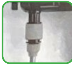
3. Sluit de slang aan op het pistool