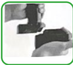
6. Lithium batterij installatie (met lader)