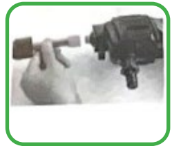
4. Installatie van de verlengde loop