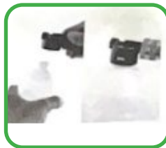
7. Sloop en installatie van schuimketel