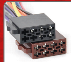
ISO connectors included