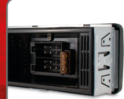
with recessed ISO connectors