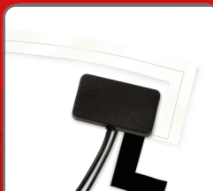
DAB+ screen mount antenna (self adhesive - transparent)