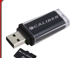
Micro SD and USB input with MP3 playback