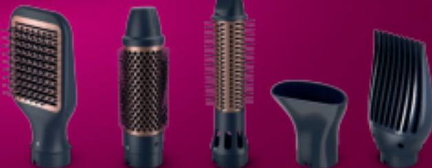
Paddle straightening brush, 38 mm ThermoBrush, 30 mm retractable brush, Narrow concentrator, Volumizer