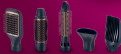
Paddle straightening brush for naturally straight hair, 38 mm ThermoBrush for smooth styles and waves, 30 mm retractable brush for defined waves, Narrow concentrator for focused airflow, Volumizer for more volume at the roots