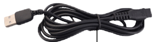
USB Kabel voor opladen