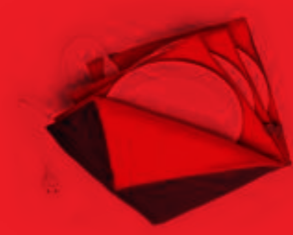
Plate Warmer MAXI GOURMET Solis