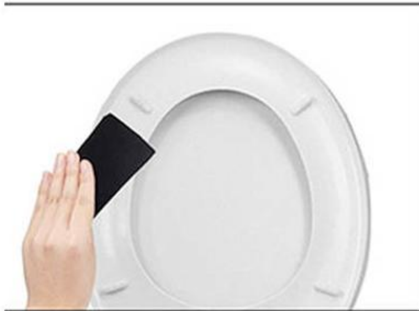
Stap 1: Maak de bril schoon en droog