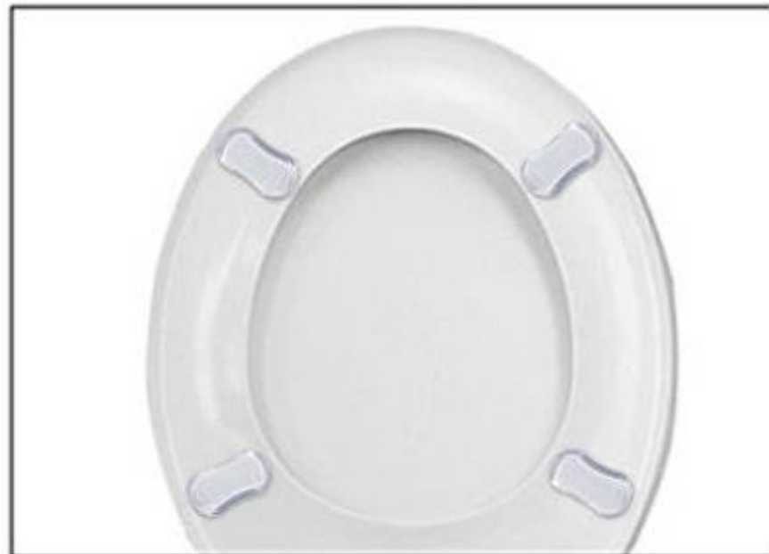
Stap 4: Klaar!