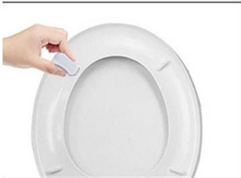
Stap 3: Plaats de buffer onder de bril