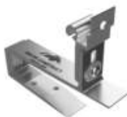
Rotatie dakhaak compleet 4019000041

Er kan gebruik gemaakt worden van twee verschillende varianten dakhaken. Links de dakhaak welke te verstellen is bij de panlat en bij het montageprofiel. Rechts de dakhaak welke alleen verstelbaar is bij de panlat.