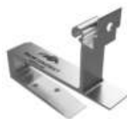
Eco rotatie dakhaak compleet 4019000031