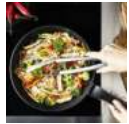
Onmisbare pan voor elke dag

De innovatieve Thermo-Signal™ in de bodem van de pan geeft aan wanneer de ideale baktemperatuur is bereikt (zandloper verdwijnt). Op deze temperatuur blijven texturen, kleuren en smaken behouden. Voor heerlijke, smaakvolle maaltijden, elke dag weer!