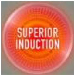
Snel koken met een bredere bodem

Ideaal voor het roerbakken van groentes, vis of vlees.