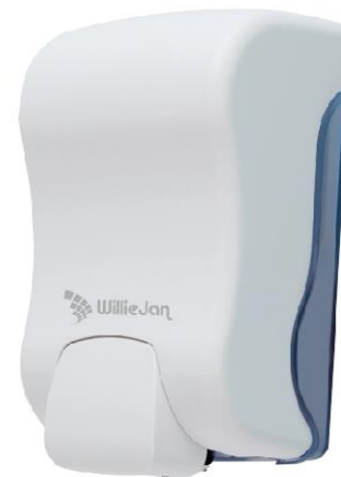
WillieJan zeepdispenser Alicate – Professionele kwaliteit – Wit – 875 ml

Het kan altijd voorkomen dat er iets niet helemaal gaat zoals gepland. We raden u aan om klachten bij ons kenbaar te maken door middel van het formulier op https://williejan.com/contact/ in te vullen of een email te sturen naar info@williejan.com