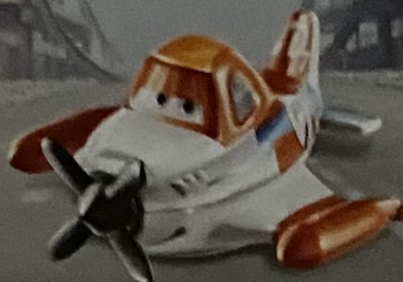
SUPERCHARGED / NEU GESTYLTER DUSTY CROPHOPPER TURBO / SUPER CARICA / SUPERPOTENCIA / SUPERCARREGADO