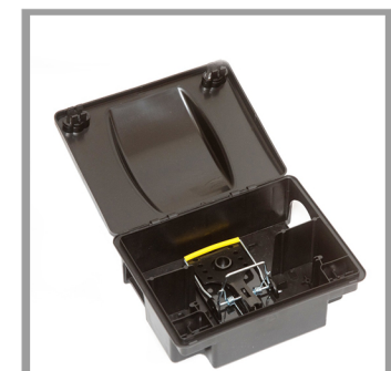
3. Plaats de val met de lokstof richting de muur