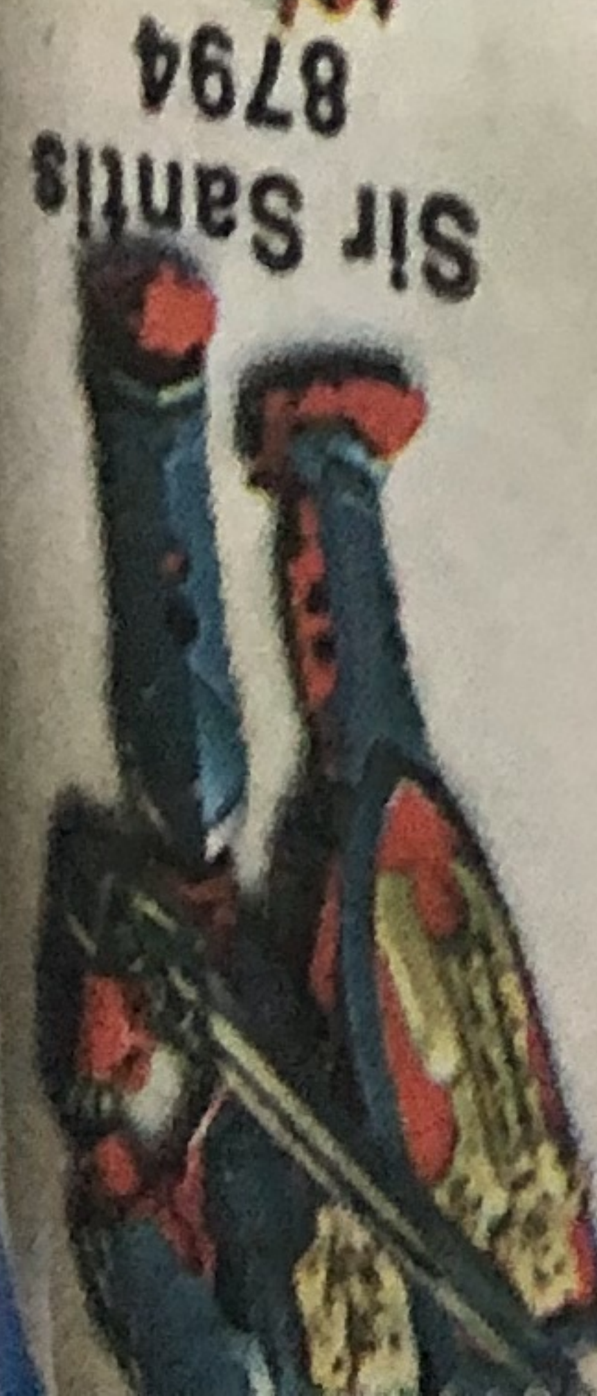
Sir Santis 8794