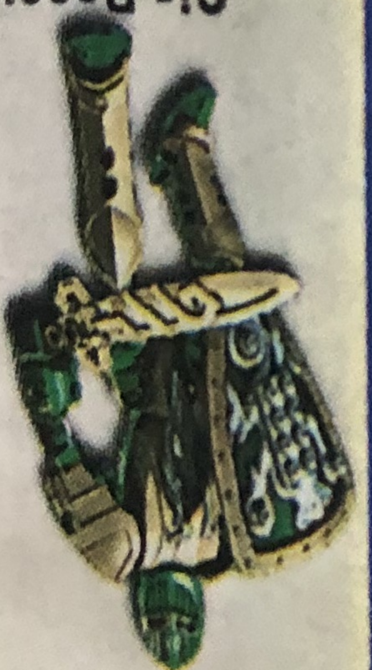
Sir Rascus 8793