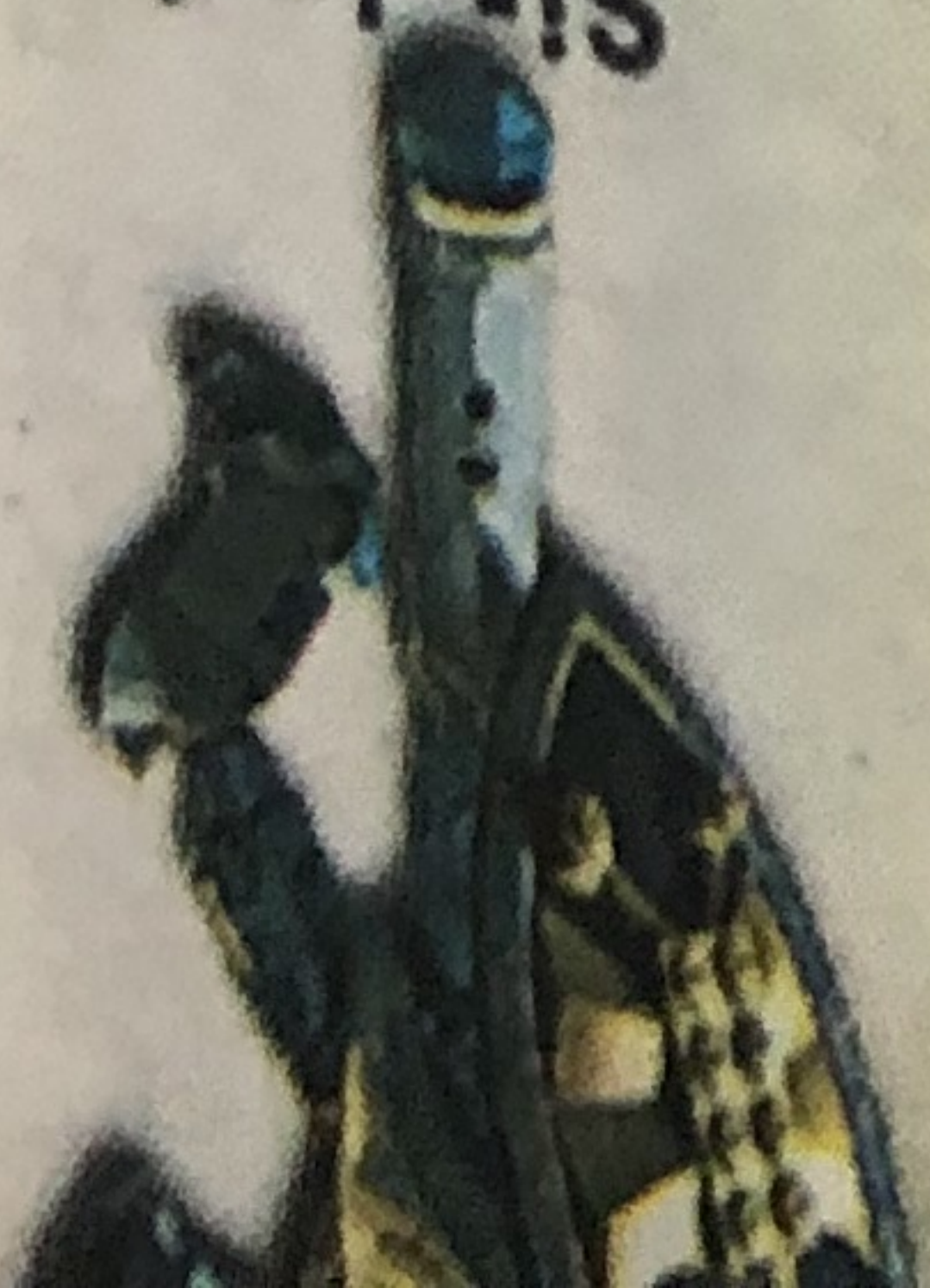
Sir Jayko 8792