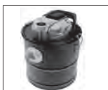
Pic 4: ASE 1020