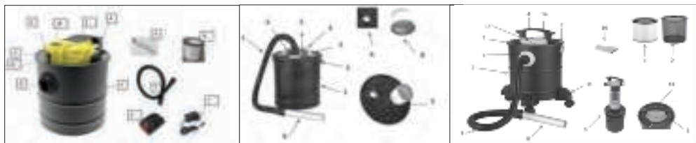
Pic 1: 2.1