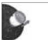
Pic 3: ASE1020 + ASZ1010