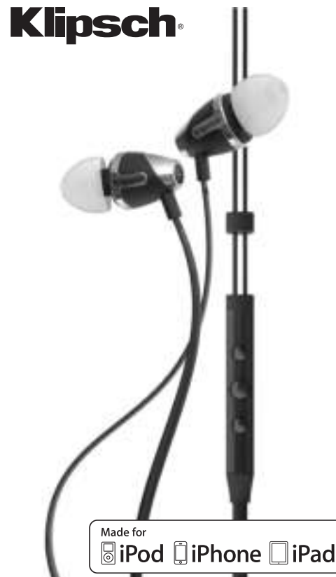
Image S4i Headphones