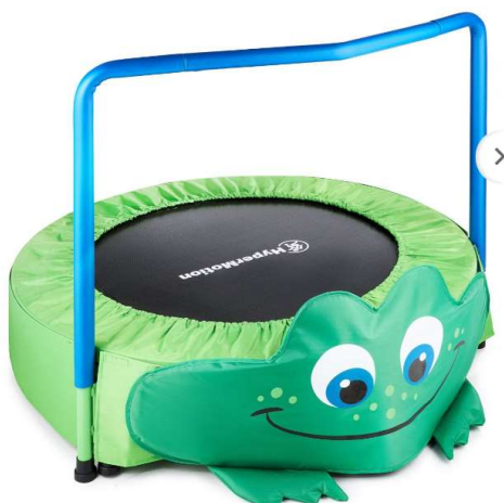
TRAMPOLINA FROG 36 MSG-1001-36''-QW 36'' 5900168934764

Wymienione powyżej przedmioty w niniejszej deklaracji są zgodne z odnośnymi wymaganiami unijnego prawodawstwa harmonizacyjnego: Dyrektywa Parlamentu Europejskiego 2009/48/WE z dnia 18 czerwca 2009.