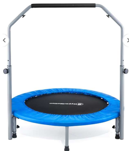
TRAMPOLINE 97 CM MSG-1001-38" 97cm 5900168935051