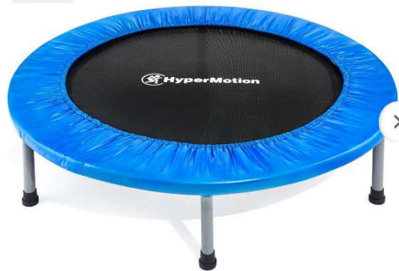
TRAMPOLINE 91 CM MSG-1001-36" 91cm 5900168935044