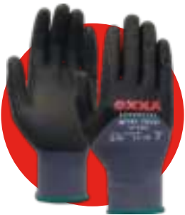
NITRI-TECH 14-692 Art. nr. 1.14.692.00