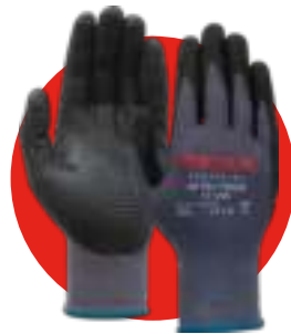
NITRI-TECH 14-695 Art. nr. 1.14.692.00