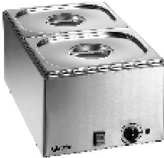
200.232 2 x 1/2 GN