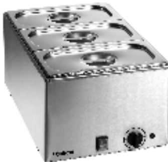
200.233 3 x 1/3 GN