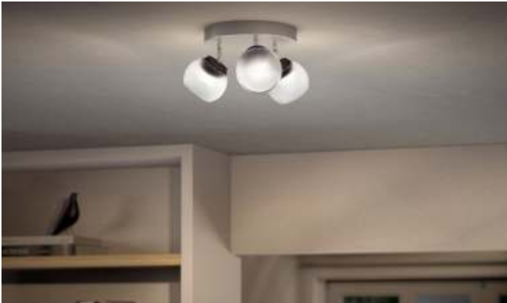
PHILIPS myLiving Spot Balla chrome mat LED