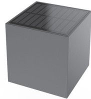
Plaatsing / Ortung / Location