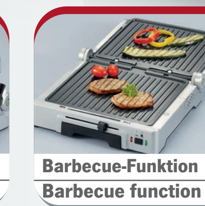
Barbecue-Funktion Barbecue function