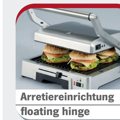
Arretiereinrichtung floating hinge