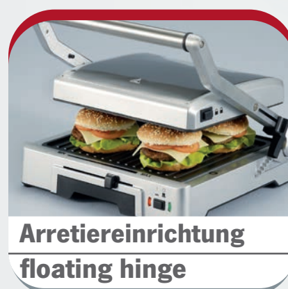
Arretiereinrichtung floating hinge