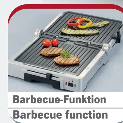
Barbecue-Funktion Barbecue function