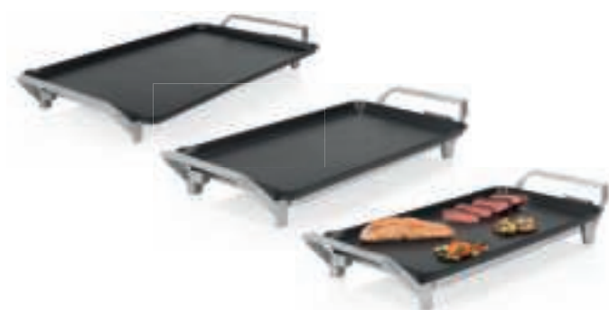
Table Chef Premium Table Chef Premium XL | Table Chef Premium XXL 01.103100.01.001 | 01.103110.01.001 | 01.103120.01.001

PARTS DESCRIPTION / ONDERDELENBESCHRIJVING / DESCRIPTION DES PIÈCES / TEILEBESCHREIBUNG / DESCRIPCIÓN DE LAS PIEZAS / DESCRIÇÃO DOS COMPONENTES / DESCRIZIONE DELLE PARTI / BESKRIVNING AV DELAR / OPIS CZĘŚCI / POPIS SOUČÁSTÍ / POPIS SUČASTI / ОПИСАНИЕ ЗАПЧАСТИ