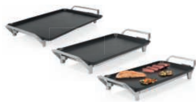
Table Chef Premium Table Chef Premium XL | Table Chef Premium XXL 01.103100.01.001 | 01.103110.01.001 | 01.103120.01.001

PARTS DESCRIPTION / ONDERDELENBESCHRIJVING / DESCRIPTION DES PIÈCES / TELEBESCHREIBUNG / DESCRIPCIÓN DE LAS PIEZAS / DESCRIÇÃO DOS COMPONENTES / DESCRIZIONE DELLE PARTI / BESKRIVNING AV DELAR / OPIS CZĘŚCI / POPIS SOUČÁSTÍ / POPIS SOUČASTI / ОПИСАНИЕ ЗАПЧАСТИ