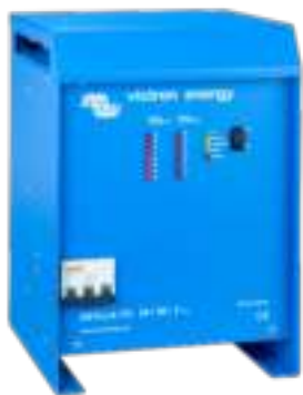
Skylla TG 24 50 3 phase

In ons boek 'Altijd Stroom' kunt u meer lezen over accu's en het laden van accu's (gratis verkrijgbaar bij Victron Energy en beschikbaar op www.victronenergy.com ).