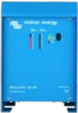
Skylla TG 24 50