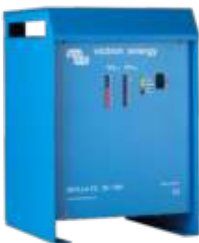
Skylla TG 24 100