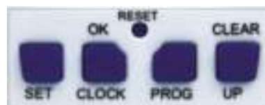
rys. 2 Przyciski funkcyjne