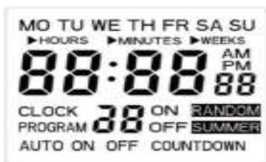
rys. 1 Wyświetlacz LCD