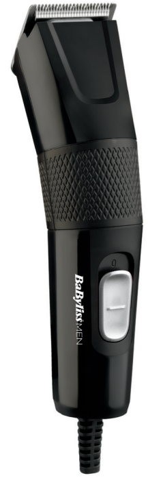
Made in China Fabriqué en Chine E756E - T156a