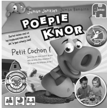
Poepie Knor 17563

Kijk voor een compleet overzicht van alle Jumbo spellen en verkoopadressen op: www.jumbo.eu