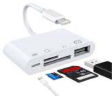
(Model 4-1 SD-TF-USB-Lightning)

Deze handleiding is van toepassing op onderstaande modellen :