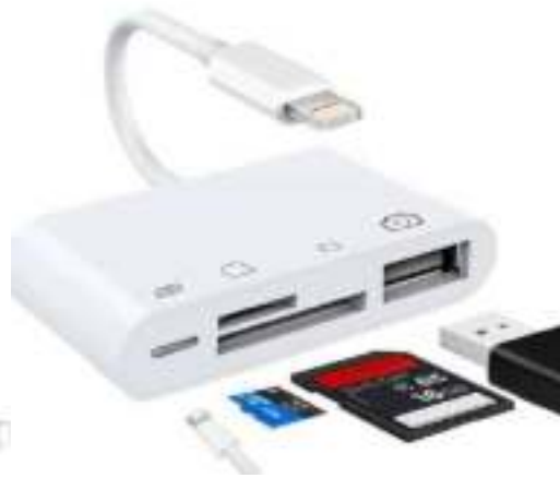
(Model 4-1 SD-TF-USB-Lightning)