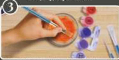
3 When switching to a new color, be sure to thoroughly clean your brush so that your colors do not mix together.

(FR) Au premier passage, bien nettoyer le pinceau avant de passer à une nouvelle couleur, afin que les couleurs ne se mélangent pas. (EN) Clean the brush thoroughly before switching to a new color, so that your colors do not mix together. (DE) Am ersten Durchgang das Pinsel gut reinigen, bevor man mit einer anderen Farbe weiterarbeitet. (RU) При первом проходе тщательно очистить кисть перед тем, как перейти к новой краске, чтобы краски не смешивались. (ES) Cuando se cambia a un nuevo color, hay que limpiar bien el pincel para que los colores no se mezclen entre sí.