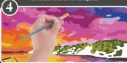
4 Paint with the darkest colors last. If you make a mistake, use a darker color to re-define your edge.

(FR) Schlier die Farben nur die abgedeckten Flächen. Am ersten Durchgang, die Kiste je eine farbige Fläche ganzflächig von der abgedeckten Fläche reinigen. Falls man auf eine andere Farbe wechseln will, kann man nur eine abgedeckte Fläche des Behälter neu freilegen. (EN) Mix colors only the covered areas. At the first pass, clean the entire surface of the paint pot. (DE) Rührte nur die abgedeckten Flächen durcheinander. Am ersten Durchgang das Pinsel von der abgedeckten Fläche neu freilegen. (RU) Смешивать краски только в закрытых емкостях. При первом проходе очищать всю поверхность емкостей. (ES) Preparar solo el color más oscuro al final. Si hay un error, utilizar un color más oscuro para redefinir el contorno.