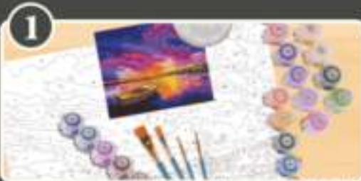
1 Lay out all of your contents. Notice the numbers on the included paint pots correspond to numbered areas on your canvas.

(FR) Lire attentivement votre page. Les numéros sur de nombreux formats indiquent tous les numéros sur cet écran. (EN) Also thoroughly read the page. The numbers on the individual formats represent the numbers shown on this screen. (DE) Lesen Sie bitte sorgfältig die Seiten. Die Zahlen auf den einzelnen Formaten entsprechen den Nummern auf dem Bildschirm. (RU) Прочтите внимательно эту страницу. Все номера на отдельных форматах соответствуют номерам на экране монитора. (ES) Preparar todos los formatos. Comprobar que los números de los formatos de pintura coinciden con los números a las secciones numeradas del lienzo.