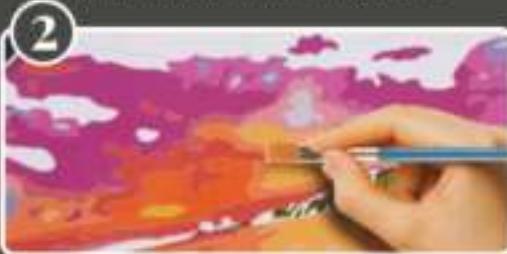
2 Fill in the numbered shape completely, painting all the way over the outline. Start by using your lightest colors first.

(FR) Schlier alle Stellen in der die Farbe Mischen, sich über die Linie hinaus. Beginnen Sie mit den hellsten Farben. (EN) Do not mix colors from individual sections and do not cross the lines. Start by using the lightest colors. (DE) Rührte vollständig die Farben durcheinander, an jedem Ort bis zur Linie hinüber. Beginnen Sie mit den hellsten Farben. (RU) Смешивайте полностью все краски, не переходя при этом на соседние участки. Начните с использования самых светлых красок. (ES) Refrescar la sección numerada por completo, comenzando desde el fondo del contenedor. Empezar siempre primero el color más claro.