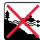
Figure 14 - Do not use in offshore current / Nicht bei Offshore-Strom verwenden / Non usare in corrente offshore / No usar en corriente costa afuera / Nie stosować w prądach morskich / Ikke bruk i offshore strøm / Använd inte i offshore ström / Не использовать в оффшорном токе / Não use em corrente offshore / Niet gebruiken in offshore-stroom / Ne pas utiliser dans le courant offshore