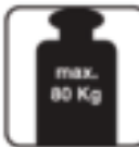
Figure 28 - Max. Load capacity. / maximale Tragfähigkeit / capacità di carico massima / capacidad de carga máxima / maksymalna ładowność / maks belastningskapasitet / max lastkapacitet / максимальная грузоподъемность / capacidade de carga máxima / Maximale draagkracht / Max. La capacité de charge