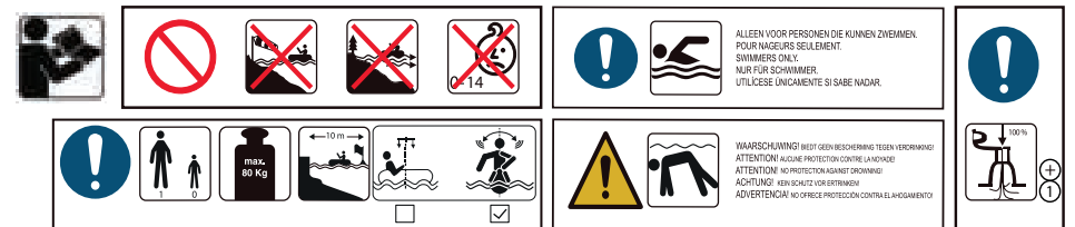
Type: SE Heartshaped Rainbow Airbed with Glitters inside