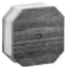
Smart Accordion Lamp (Wood or Velvet finishing)