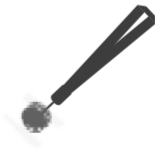
The Magnet Strap