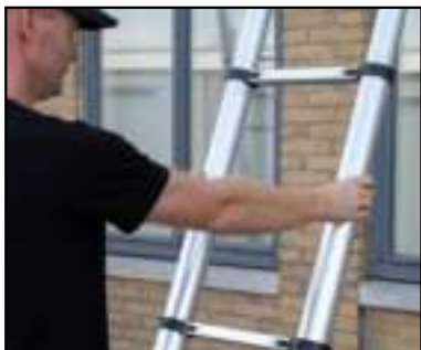
FIGUUR 1 HOEK VAN 75 GRADEN