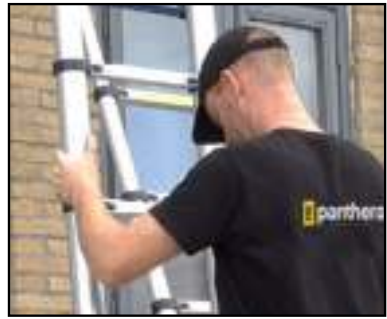
FIGUUR 6 PLAATSING HANDEN