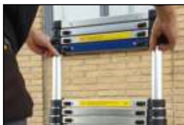
FIGUUR 5 BIJ GEDEELTELIJK UITTREKKEN BEGIN MET DE GEWENSTE SPORT