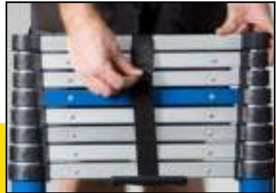
FIGUUR 7 KLITTENBAND