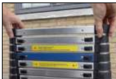
FIGUUR 4 BIJ VOLLEDIG UITTREKKEN BEGIN MET DE BOVENSTE SPORT