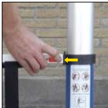
FIGUUR 3 ONTGRENDELING