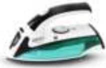
Travel Iron CR 5024