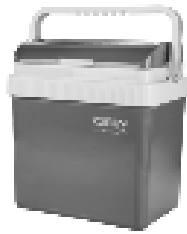
Portable cooler CR 8065