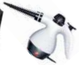
Steam Cleaner CR 7021