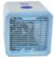
Easy Air Cooler CR 7318