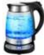
Electric Kettle CR 1242