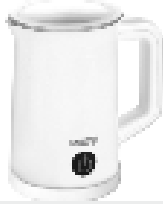
Milk Frother CR 4464