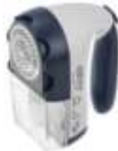
Lint remover CR 9606