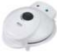
Waffle maker CR 3022