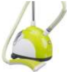
Steam Cleaner CR 5020