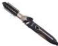
Hair styler set CR 2024