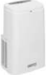
Air conditioner CR 7907