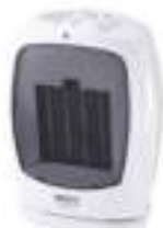
Ceramic Heater CR 7718