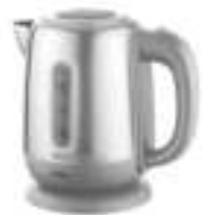
Electric Kettle CR 1278