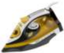
Steam Iron CR 5029