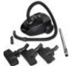
Super silent vacuum cleaner CR 7037