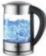
Kettle with temp. control CR 1289