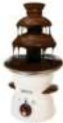
Chocolate Fountain CR 4457