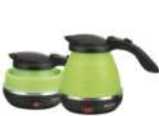
Foldable Electric Kettle CR 1265