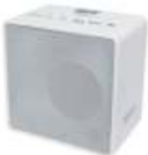
Cube Radio with bluetooth CR 1165