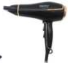
Hair Dryer CR 2255