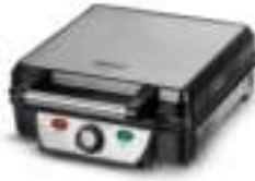
Waffle maker CR 3025