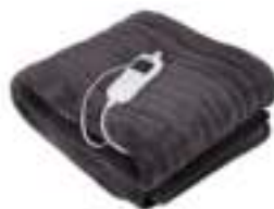
Super soft heating blanket CR 7418