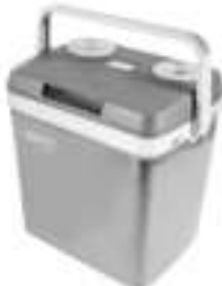
Portable Cooler CR 93