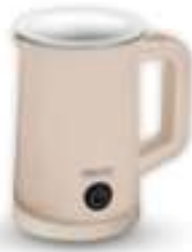
Automatic milk frother CR 4464