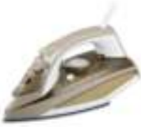
Steam iron CR 5018