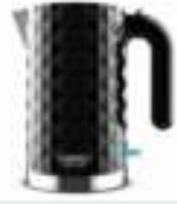
Electric Kettle CR 1169