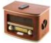
Retro radio CR 1109