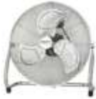
Velocity Fan CR 7306