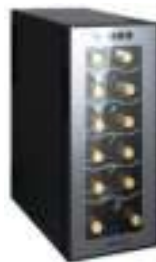
WINE COOLER CR 8068