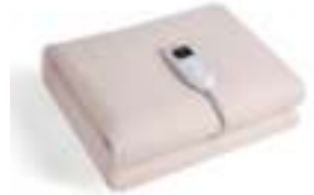
Electric Blanket CR 7407