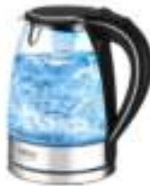
Electric Kettle CR 1239