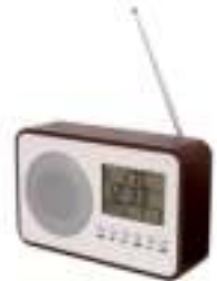
Radio CR 1153