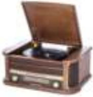
Turntable with radio CR 1111