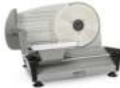
Food Slicer CR 4702