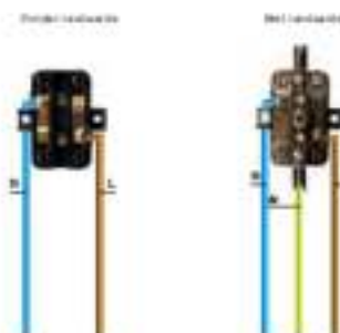
Wandcontactdoos (dubbel) Met/zonder randsaarde

Wandcontactdoos voor montage op de muur om apparaten, lampen en verlengsnoeren op het elektriciteitsnet aan te sluiten.