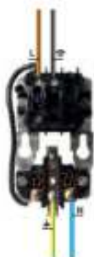
Combinatieschakelaar Met randsaarde

Met de combinatieschakelaar combineert u twee functies in één opbouwdoos.