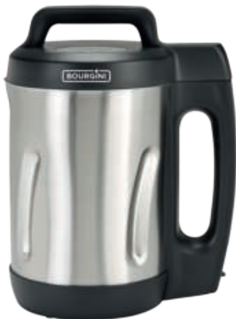
21.4000.00.00 Classic Soup Maker