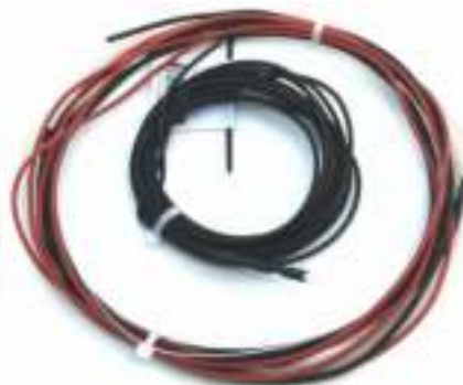
Met bi metaal thermostaat