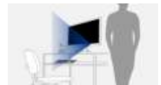
Sensor herkent verlaten werkplek