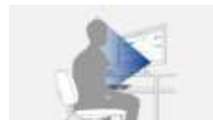
Sensor herkent persoon op werkplek

Met de aanwezigheidssensor (EcoView-Sense) bespaart u stroom en verlaagt u uw energiekosten. Het principe erachter: Als u achter het beeldscherm zit, staat de monitor aan. Als u uw werkplek verlaat, schakelt het beeldscherm automatisch over op de spaarmodus. Zodra u terugkeert, wordt het beeldscherm weer actief, volledig automatisch met behulp van de bewegingssensor.