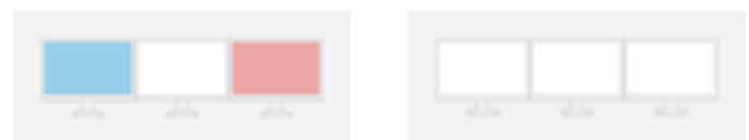
Zonder Multi-Monitor Matching

Alle FlexScan-monitoren worden geleverd inclusief de software ScreenManager Pro, waarmee u kleur- en EcoView-instellingen via de muis en het toetsenbord kunt instellen, in plaats van via het Display-menu. U hebt hiervoor alleen de signaalkabel of een USB-aansluiting nodig. Met de functie Multi-Monitor Matching kunt u aanpassingen doorvoeren voor alle met dezelfde pc verbonden FlexScan-monitoren.