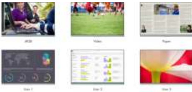
Afbeelding ter illustratie

De FineContrast-modi maken het werken met en bekijken van afbeeldingen, teksten en films eenvoudiger. Want voor de kleurinstelling maakt het verschil of u een film bekijkt, een afbeelding bewerkt, op internet surft of teksten schrijft. Met één druk op de knop stelt u de betreffende basisinstelling voor helderheid, gammacorrectie en kleurtemperatuur in. Dankzij de meegeleverde software, ScreenManager Pro, kunt u aan elke toepassing eenodus toewijzen, die als u het programma start automatisch wordt geactiveerd. De Paper-modus bijvoorbeeld simuleert het aangename contrast van boeken doordat deze de hoeveelheid blauw licht vermindert. Daarnaast kunt u zelf instellingen aanpassen. Een handige optie voor artsen is de DICOM-modus: Deze zorgt via de DICOM-luminantiecurve voor de optimale beeldweergave van radiologische beelden.