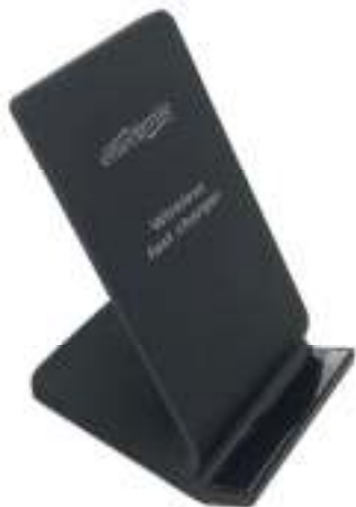
EG-WPC10-02 WIRELESS PHONE CHARGER STAND, 10 W