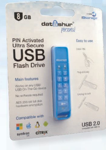
datAshur Personal® in de retail verpakking