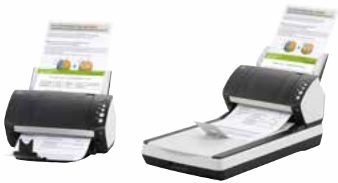
fi-7140 / fi-7240 – A4 Staand op 300 dpi 40 ppm / 80 ipm Scan gemengde batches via de invoergleuf voor 80 vel