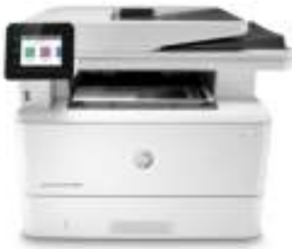
Imprimante multifonction HP LaserJet Pro M428fdn

Le secret de la réussite d'une entreprise : travailler intelligemment. L'imprimante multifonction HP LaserJet Pro M428 est conçue pour vous laisser vous consacrer aux tâches assurant la croissance efficace de votre entreprise et vous permettant de rester en tête de la concurrence.