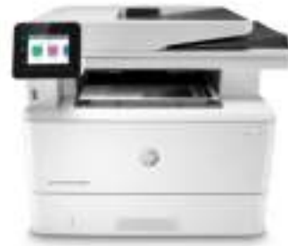
Imprimante multifonction HP LaserJet Pro M428fdw

Cette imprimante a été conçue pour fonctionner uniquement avec des cartouches disposant d'une puce HP neuve ou réutilisée. Elle est équipée d'un dispositif de sécurité dynamique pour bloquer les cartouches intégrant une puce non-HP. Les mises à jour périodiques du micrologiciel permettent d'assurer l'efficacité de ces mesures et bloquent les cartouches qui fonctionnaient auparavant. Une puce HP réutilisée permet d'utiliser des cartouches réutilisées, reconditionnées ou recyclées. Plus d'informations sur: Pour en savoir plus, consultez: www.hp.com/learn/ds