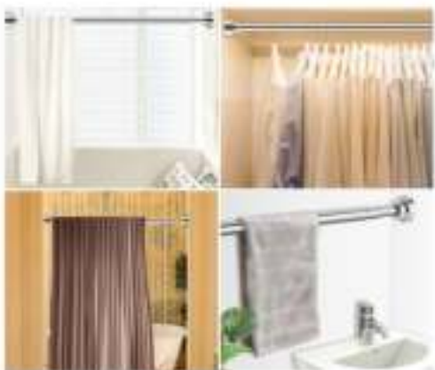
Telescopic shower curtain rod