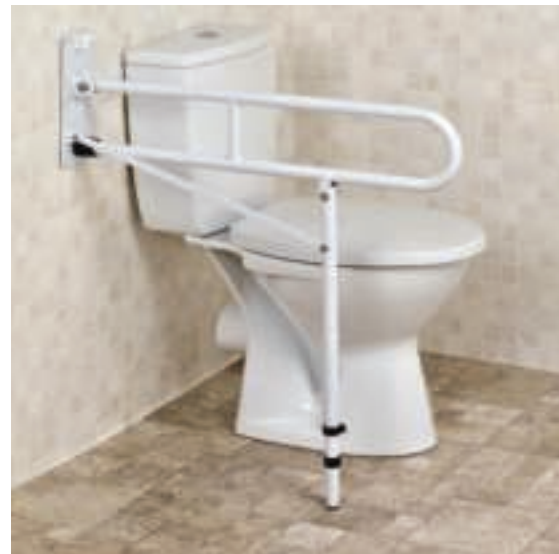
Figuur 1 – M48465 Gebruik

Let op: Omdat de montagesubstraat aanzienlijk kan variëren, leveren wij geen bevestigingen. Zorg ervoor dat de gekozen bevestigingen geschikt zijn voor het doel en compatibel zijn met zowel het product als de montagesubstraat. Neem in geval van twijfel contact op met een gekwalificeerd persoon.