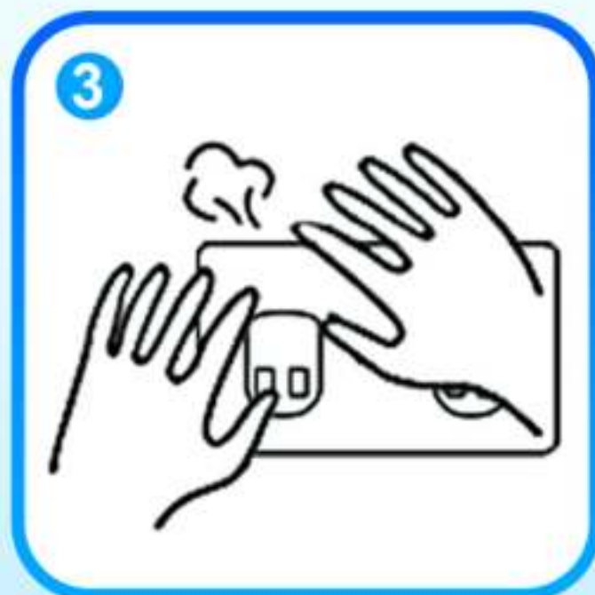
3. Plak de folie en druk alle lucht eruit