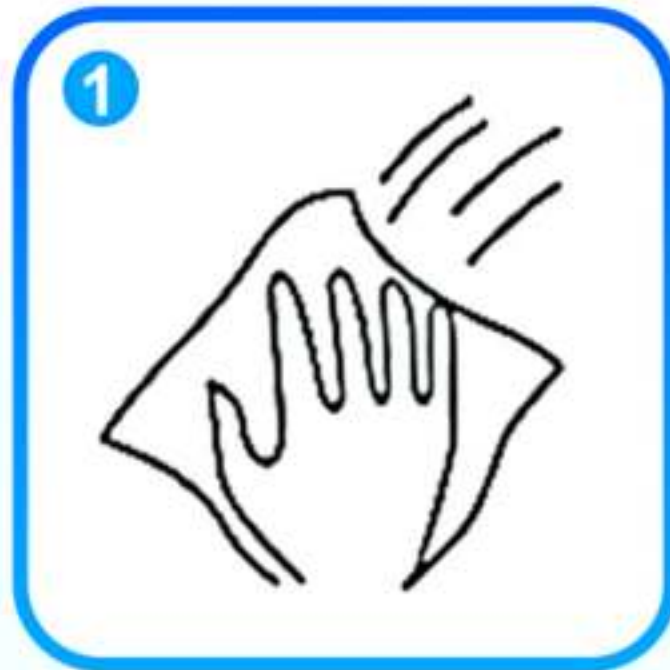
1. Reinig het oppervlak