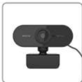
Full HD Webcam