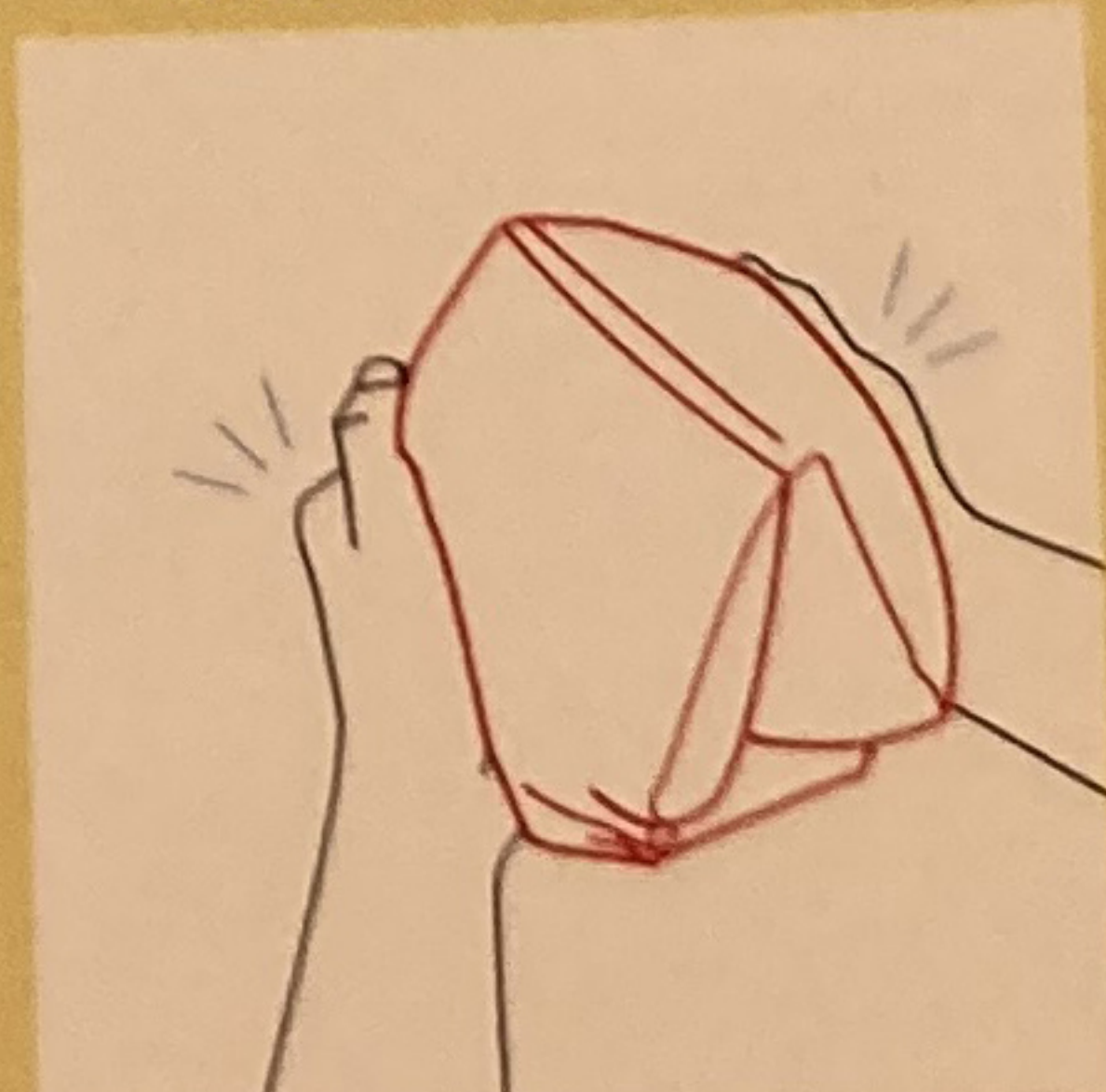
Squeeze back and slide up arm