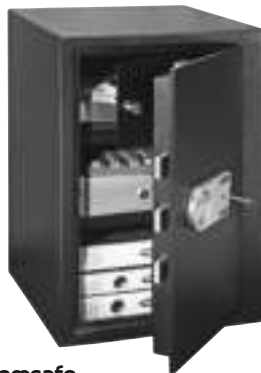
Comsafe Monaco DB-65