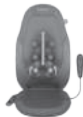
Mecanismo de masaje Shiatsu con Gel móvil 2 en 1

CALOR – Para disfrutar de un calor relajante durante el masaje, solo tiene que pulsar el botón de calor y se iluminará el piloto rojo. Para cambiar la selección, solo tiene que pulsar el botón de nuevo y se apagará el piloto correspondiente. Para su seguridad, el calor no se puede activar si no se ha seleccionado el programa de masaje apropiado.