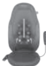
Pohyblivý gelový Shiatsu masážní mechanismus

Z bezpečnostních důvodů nelze teplo aktivovat, pokud není zvolena masáž.