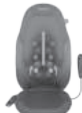
Kaksi yhdessäliikkuva Gel-shiatsu-hierontamekanismi

Turvallisuussyistä lämpöä ei voi kytkeä päälle, jos hierontatoimintoa ei ole valittu.