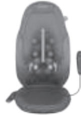
2'si 1 arada hareket eden Gel Shiatsu masaj mekanizması

Güvenliğiniz için ilgili masaj programı açık değilken ısı kullanımı açılmaz.