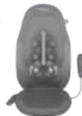
2 in 1 gleitendes Gel das Shiatsu-Massagegerät

Aus Sicherheitsgründen ist es nicht möglich, die Wärmefunktion einzuschalten, wenn nicht das entsprechende Massageprogramm läuft.