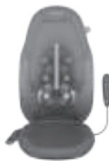
Meccanismo di massaggio Shiatsu mobile 2 in 1 con Gel

Per motivi di sicurezza, la funzione termica può essere attivata solo se viene selezionato il corrispondente programma massaggiante.