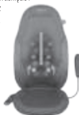
Ruchomy mechanizm do masażu Shiatsu z technologią Gel 2 w 1

Ze względu na bezpieczeństwo, funkcja ogrzewania nie może być włączona, gdy odpowiedni program jest wyłączony.