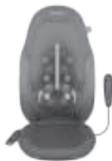
Подвижный механизм 2 в 1 для массажа шиатцу с гелем Gel

В целях безопасности прогресс включается только при включении соответствующей программы массажа.