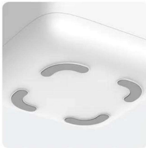
Rutschfeste Basis Stabil und schwer zu berühren