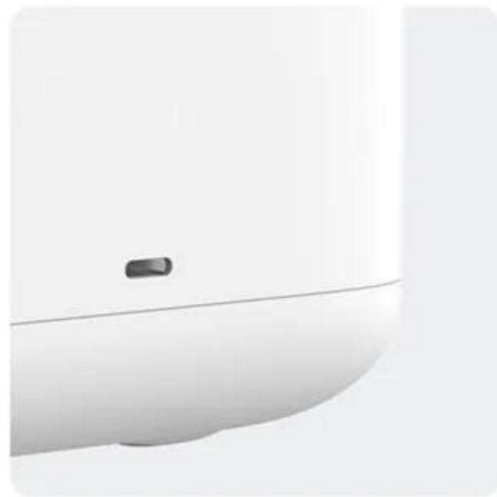
TYPE-C-Schnittstelle allgemeine internationale Standards