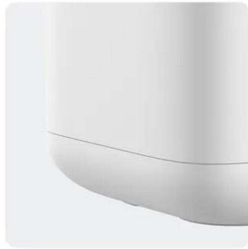
Optimizing the ABS Safe and durable material