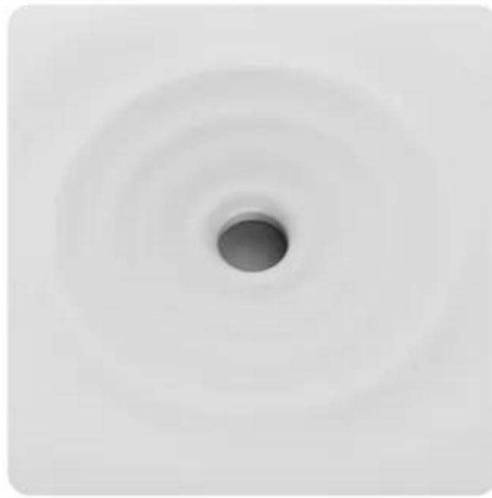
Das Wasser plätschert aus der Nebelmündung Hochwertiges Detaildesign