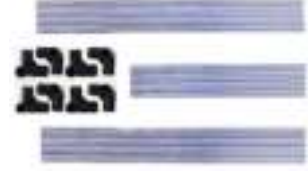
Bevestigingsbuizen en koppelstukken