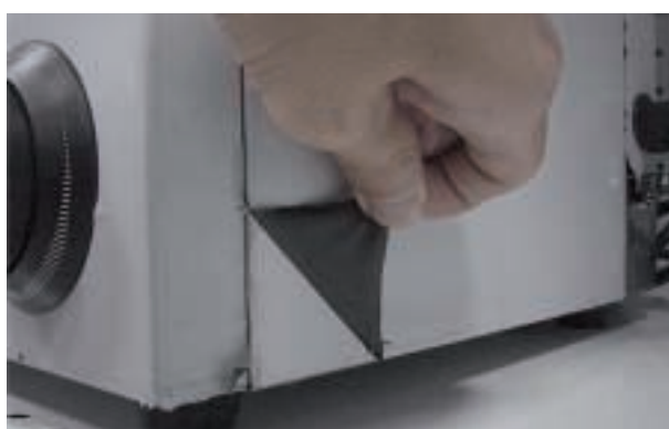
Figuur 2: Het verwijderen van de folie.