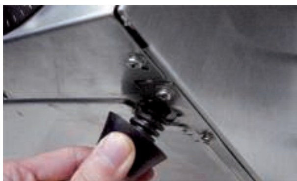
Figuur 1: Het monteren van de pootjes.