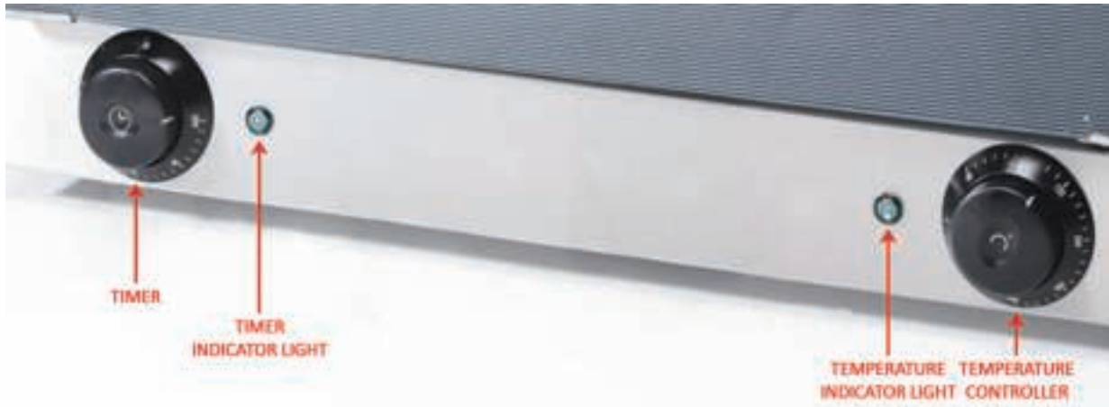
Figure 3: The control panel