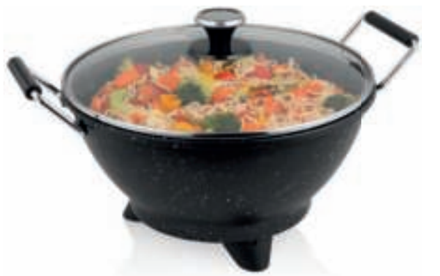
Stir-Fry Electric Wok 01.162389.01.001

PARTS DESCRIPTION / ONDERDELENBESCHRIJVING / DESCRIPTION DES PIÈCES / TEILEBESCHREIBUNG / DESCRIPCIÓN DE LAS PIEZAS / DESCRIÇÃO DOS COMPONENTES / DESCRIZIONE DELLE PARTI / BESKRIVNING AV DELAR / OPIS CZĘŚCI / POPIS SOUČÁSTI / POPIS SUČASTI / ОПИСАНИЕ ЗАПЧАСТИ