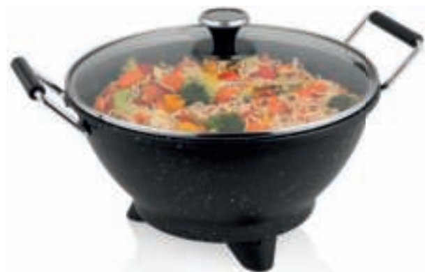
Stir-Fry Electric Wok 01.162389.01.001

PARTS DESCRIPTION / ONDERDELENBESCHRIJVING / DESCRIÇÃO DAS PEÇAS / TEILEBESCHREIBUNG / DESCRIPCIÓN DE LAS PIEZAS / DESCRIÇÃO DOS COMPONENTES / DESCRIZIONE DELLE PARTI / BESKRIVNING AV DELAR / OPIS CZĘŚCI / POPIS SOUČÁSTI / POPIS SUČASTI / ОПИСАНИЕ ЗАПЧАСТИ